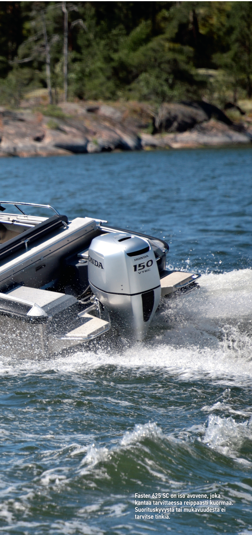
Faster 625 SC on iso avovene, joka kantaa tarvittaessa reippaasti kuormaa. Suorituskyvystä tai mukavuudesta ei tarvitse tinkiä.